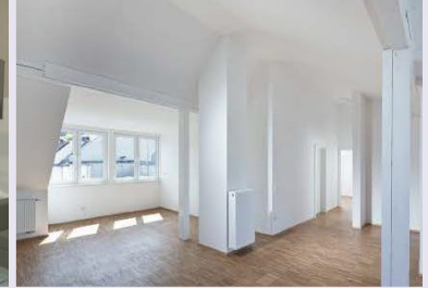
Bilder unsaniert, Visualisierung Sanierungsbeispiel, Referenz